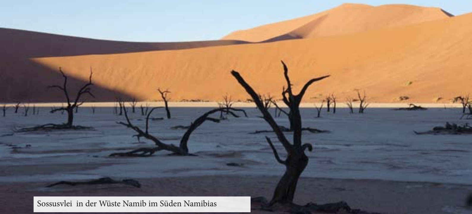
Sossusvlei in der Wüste Namib im Süden Namibias